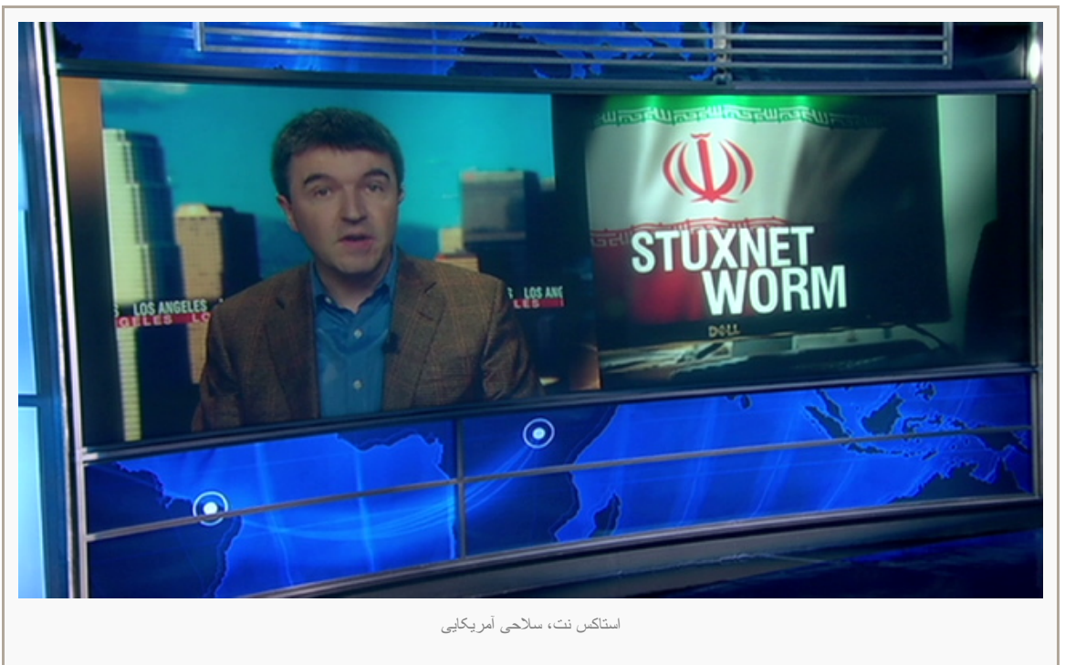
استاکس نت، سلاحی آمریکایی

حال مسئله بسیار مهم در بُعد امنیت ملی اینست که با وجود اطمینان از اینکه هرگونه نصب، کارگذاری و کنترل تجهیزات سایبری در سراسر دنیا از سوی آمریکا و سازمان‌های بین‌المللی تحت لوای آمریکا، در نهایت به اعمال نظارت و کنترل آژانس امنیت ملی آمریکا و سرفرماندهی ارتباطات دولتی انگلیس منتهی می‌شود، چرا به صراحت در متن طرح اقدام مشترک ژنو از سوی دولت اعتدال پذیرفته شده که چنین نظارت غیرقانونی که بر خلاف قوانین بین‌المللی و حریم خصوصی ملت‌هاست در سایت‌های اتمی ایران صورت گیرد؟